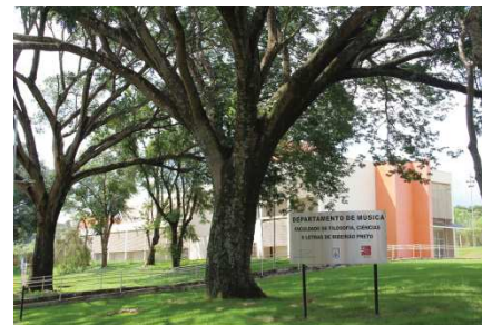
Departamento de Música da FFCLRP/USP Bloco Didático