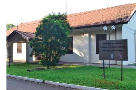
Departamento de Música da FFCLRP/USP Sala de Concertos da Tulha