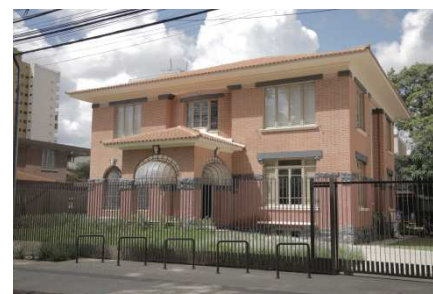
Biblioteca Sinhá Junqueira