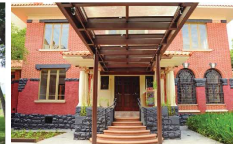
Biblioteca Sinhá Junqueira