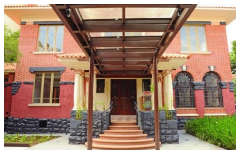
Biblioteca Sinhá Junqueira