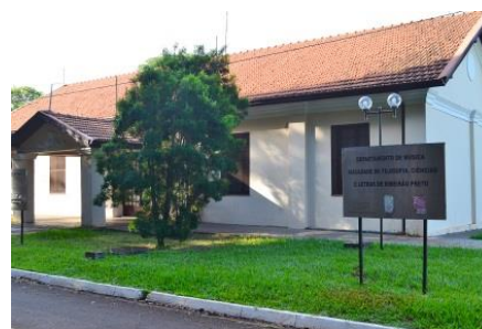
Departamento de Música da FFCLRP/USP Sala de Concertos da Tulha