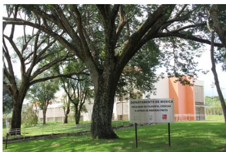
Departamento de Música da FFCLRP/USP Bloco Didático